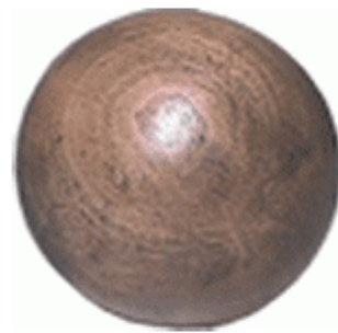
ลูกกอล์ฟที่ทำจากไม้