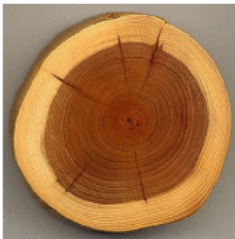
ไม้ที่ใช้ทำลูกกอล์ฟ