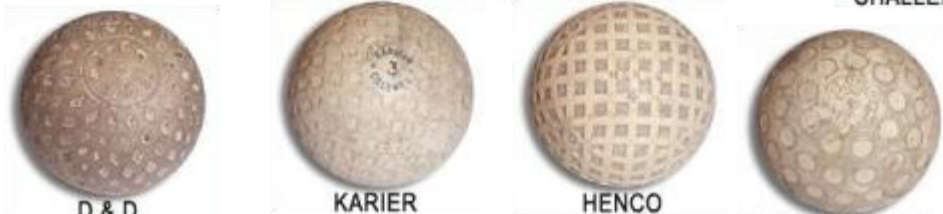
D & D