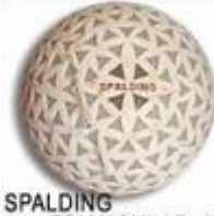
SPALDING TRIANGULAR 11