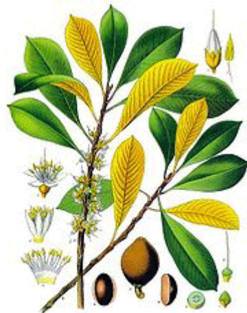
ต้นยาง Gutta Percha